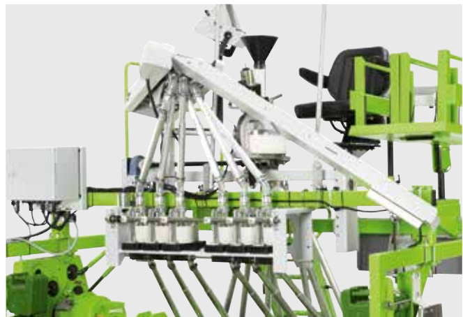
Магазинная система в комбинации с коническим дозатором для сплошного посева