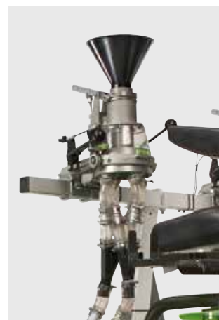
Центральный дозатор посевного материала