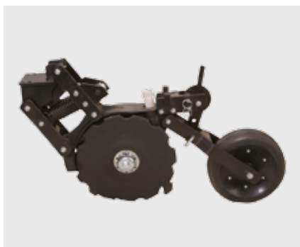
Двухдисковый сошник ACRA PLANT, междурядия от 19 см