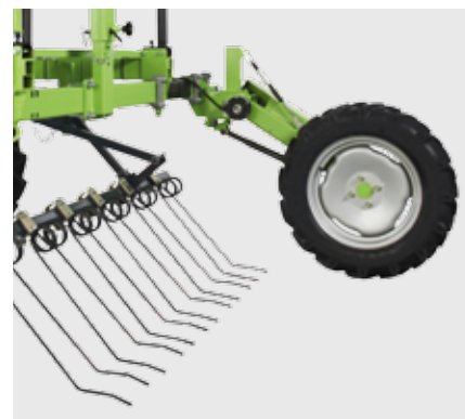
Колесо с телеметрическим датчиком