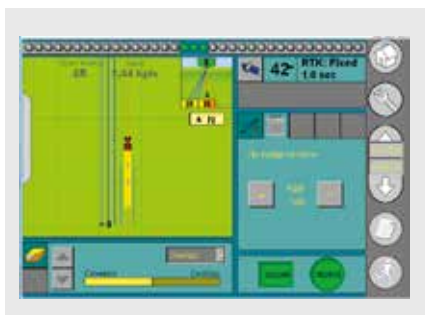
Превосходный отчет о выполняемой и выполненных операциях