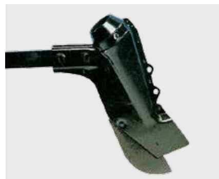
Анкерный сошник NODET, междурядия от 8,5 см