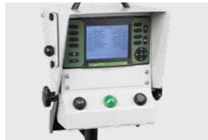
Система Global Seed Control (GSC)