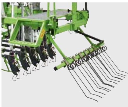
Борона с пружинными зубьями