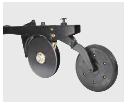
Двухдисковый сошник GREAT PLAINS, междурядия от 15 см