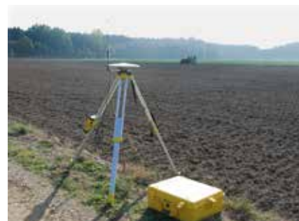
Станция RTK для навигации при посеве