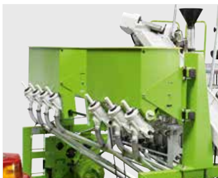
Бункер для удобрений

В зависимости от базовой рамы возможна установка следующего дополнительного оборудования: