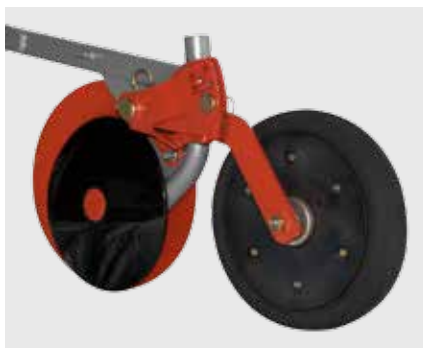
Однодисковый сошник ACCORD CX, междурядия от 9,5 см