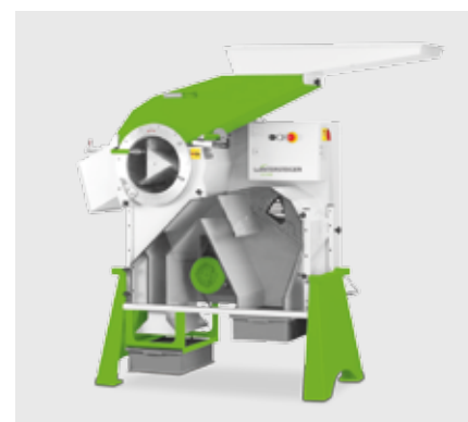
Лабораторная молотилка LD 350

Поставляя весь спектр оборудования для селекции и семеноводства, WINTERSTEIGER зарекомендовал себя надежным партнером для клиентов из самых разных отраслей: