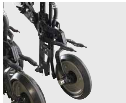
Зубчатый сошник HORWOOD Bagshaw

Под заказ могут быть установлены другие сошники.