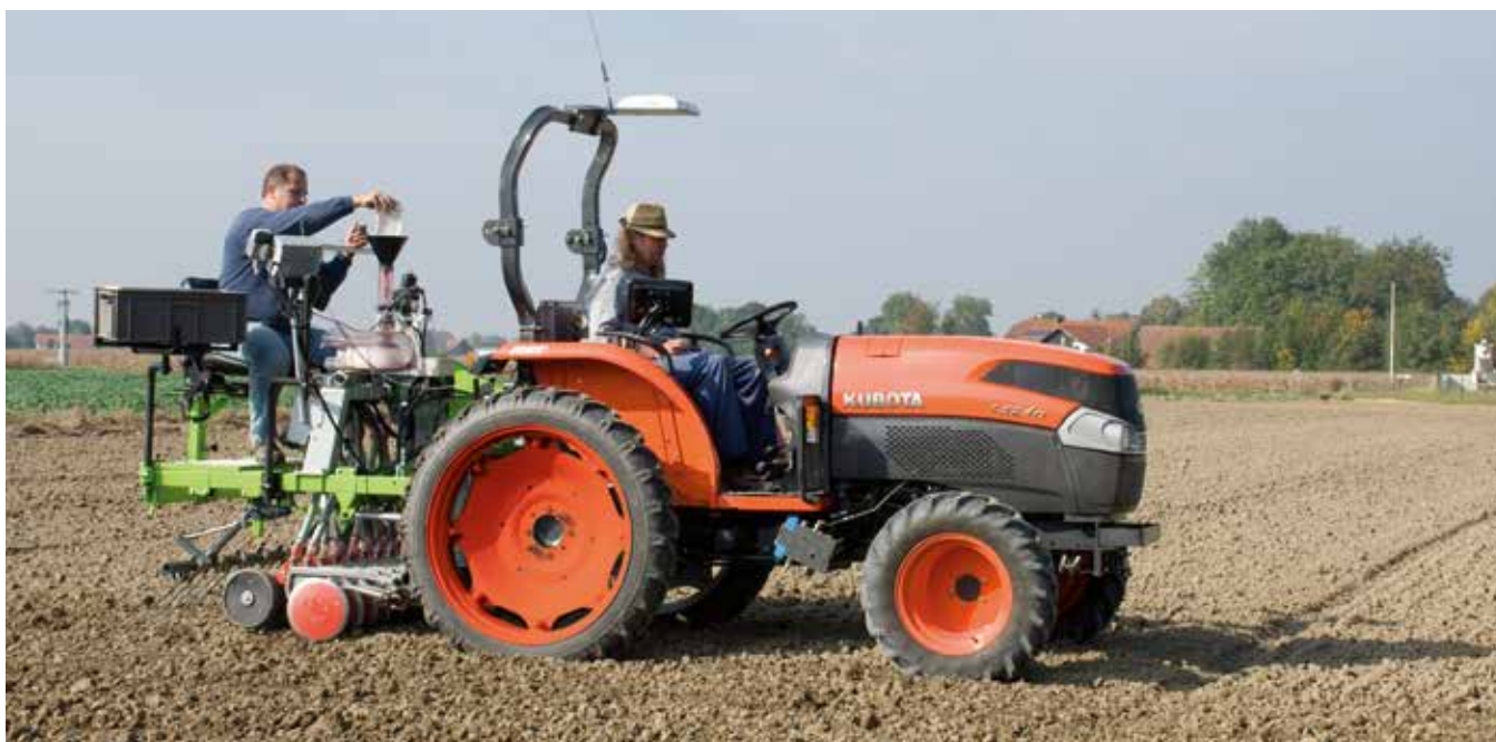
Надежный и простой посев при помощи GPS