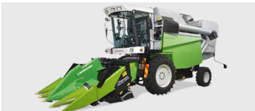
Селекционный комбайн Split

Колосовые молотилки, кукурузные молотилки, машины для влажного протравливания, измельчители зеленой массы, делители образцов семян