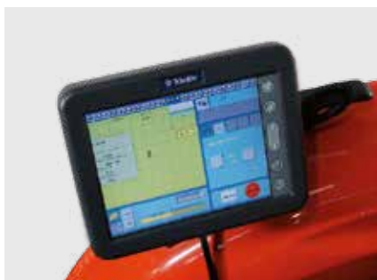
Монтаж монитора на трактор