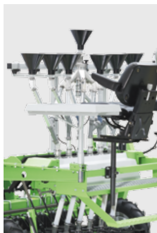
Шесть отдельных воронок в комбинации с ротационным дозатором

Содержимое каждой ячейки кассет засыпается в индивидуальный конический дозатор, откуда далее поступает в сошники. В сочетании с системой GSC посев производится полностью автоматически. Замена кассет не требует остановки сеялки. Использованные кассеты собираются в короб или мешок.