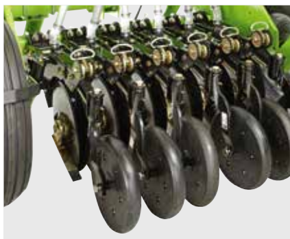
Двухдисковые сошники SUNFLOWER