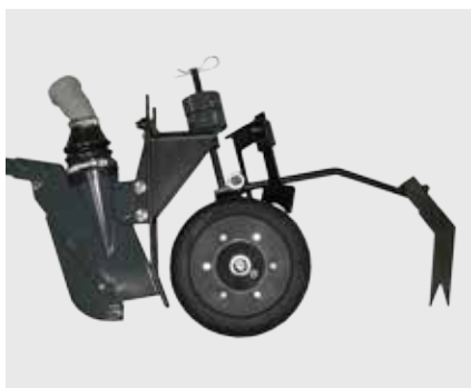
Анкерный сошник ISARIA, междурядия от 8 см