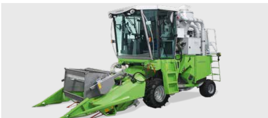
Селекционный комбайн Delta