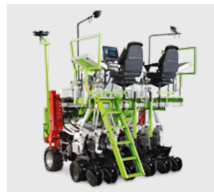
Сеялка пунктирного посева Dynamic Disc